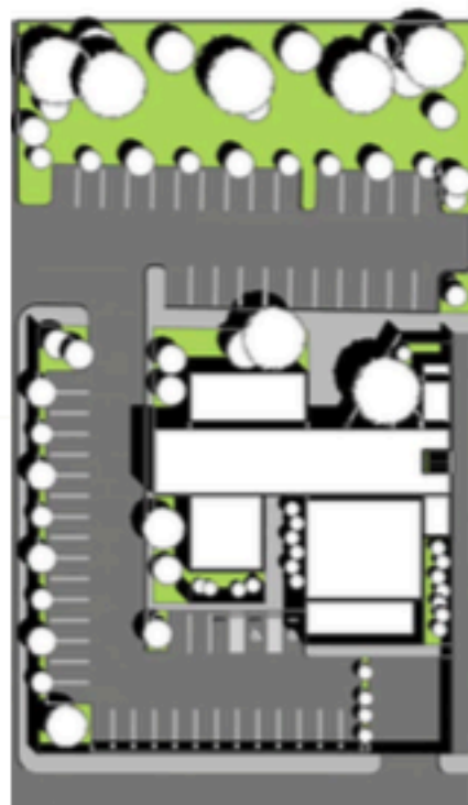
PLANTA DE CONJUNTO